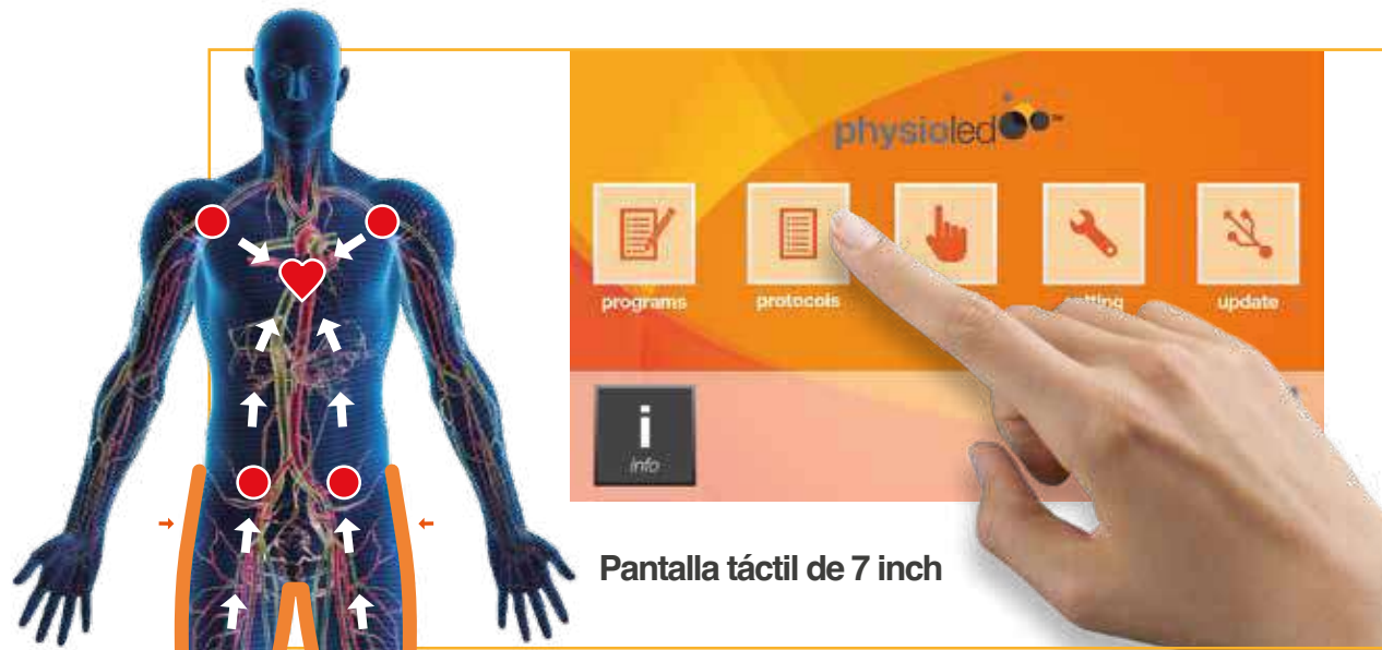
Pantalla táctil de 7 inch